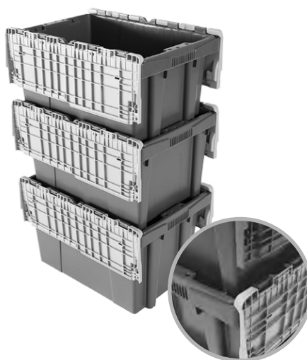
MOSAICO DE APILADO ABIERTO