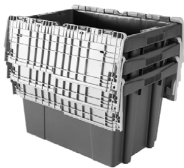
MOSAICO DE ENCAJADO