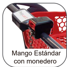
Mango Estándar con monedero