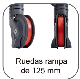
Ruedas rampa de 125 mm