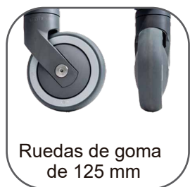
Ruedas de goma de 125 mm